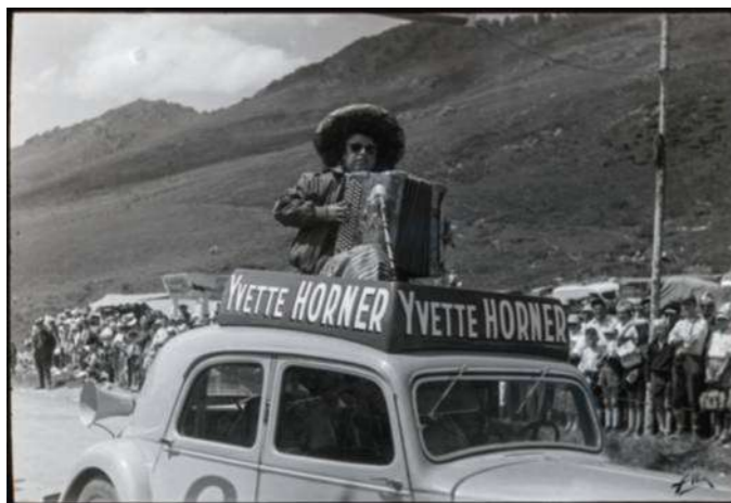
L'accordéoniste tarbaise Yvette Horner au col d'Aspin lors d'un Tour de France. Page de droite , pêcheur sur les bords de l'Adour.