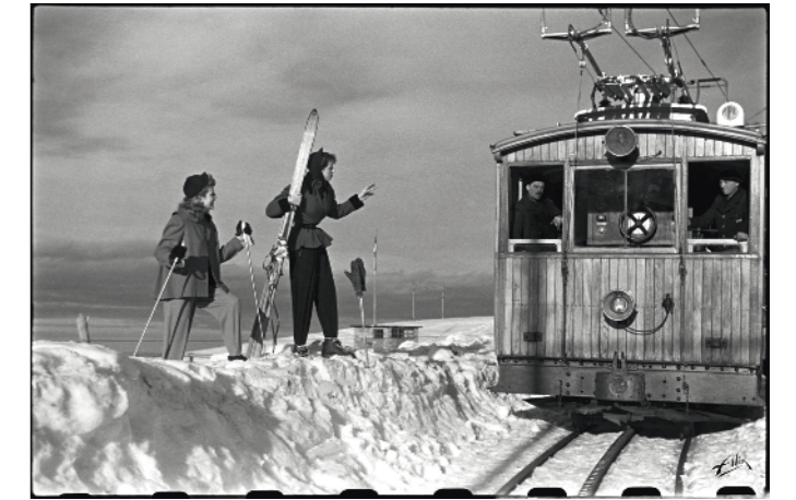
Observatoire du pic du Midi de Bigorre sous la neige en 1911 et skieuses sur le point d'embarquer dans le train à crémaillère de Luchon à Superbagnères.

Technique imparable et émotion palpable, les images du studio Alix témoignent d'un siècle de vie dans les Pyrénées, comme les débuts des établissements thermaux à Bagnères-de-Bigorre.