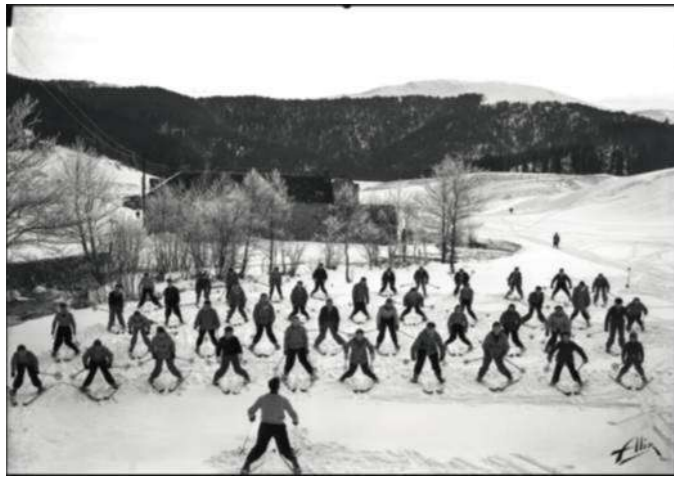
Cours de ski collectif de l'école de ski de Payolle en 1930.